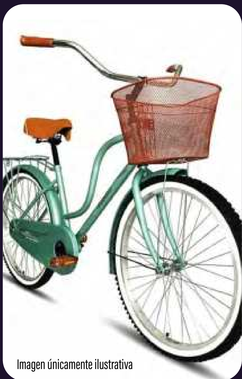
Imagen únicamente ilustrativa

Por cada $200 PESOS de COMPRA obtén UN BOLETO* para participar en nuestra dinámica y podrás ganar una BICICLETA .